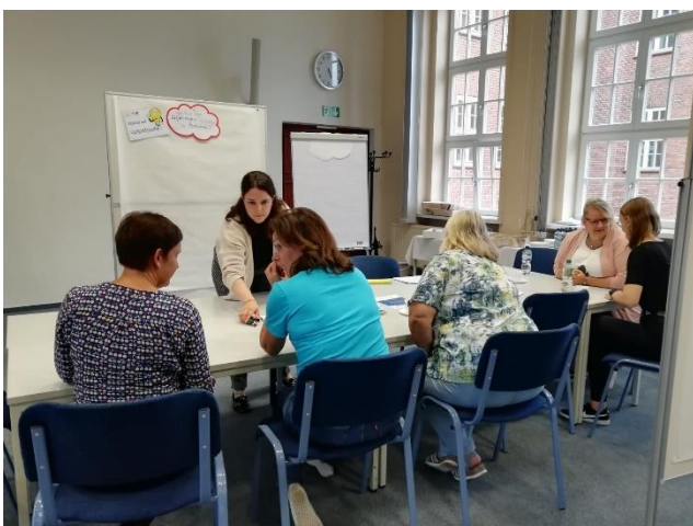
Gleichstellungswerkstatt Güstrow

Am 13. September 2023 wurden in Güstrow die Themen „Gesundheit“ und „Kindheit und Jugend“ diskutiert.