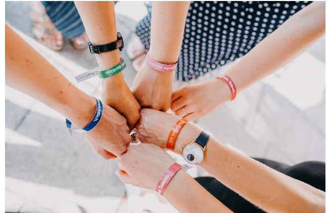
Teilnehmerinnen des Sommerfestes 2023

Teilnehmerin am Programm für Postdoktorandinnen und Juniorprofessorinnen der Universität Greifswald vom Juni 2023.