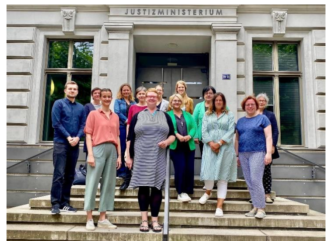
Treffen der UAG 2 „Kindheit und Jugend“ am 20. Juli 2023 in Schwerin

Zur Erarbeitung des GRP wurden 10 Unterarbeitsgruppen (UAG) gebildet, in denen die jeweiligen Fachressorts der Landesregierung sowie entsprechende Akteurinnen und Akteure der Zivilgesellschaft vertreten sind. Alle UAGs haben inzwischen zum zweiten Mal getagt und Maßnahmen für das GRP erarbeitet.