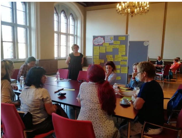
Gleichstellungswerkstatt Stralsund

Am 7. September 2023 standen in Stralsund die Themen „Migration“ sowie „Erwerb und Vereinbarkeit“ im Mittelpunkt.